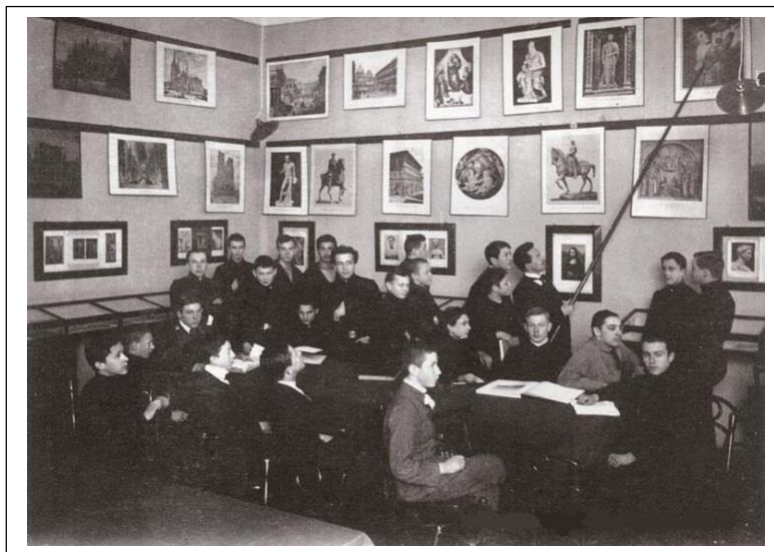
Гимназия К. Мая. Урок истории.

Отдел рукописей ГТГ, Ф. 44/3, 2 л. [1887-8 гг.]