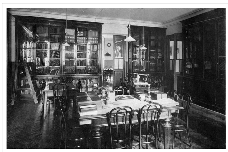
Библиотека в Гимназии К. Мая.

Отдел рукописей ГТГ, ф. 44/41, лл. 15-17.