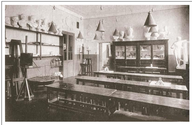
Гимназия К. Мая. Класс лепки.